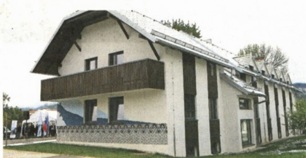
Nova stanovanja nepremičninskega sklada pokojninskega in invalidskega zavarovanja so namenjena najemu upokoјencev. STA

Za gradnjo stanovanj, ki se je začela novembra 2022, je sklad pridobil 525.000 evrov nepovratnih sredstev, kar predstavlja tretjino celotne vrednosti projekta obnove, dozidave in arhitekturne prilagoditve objekta za bivanje starejših. Uredili so dvi-