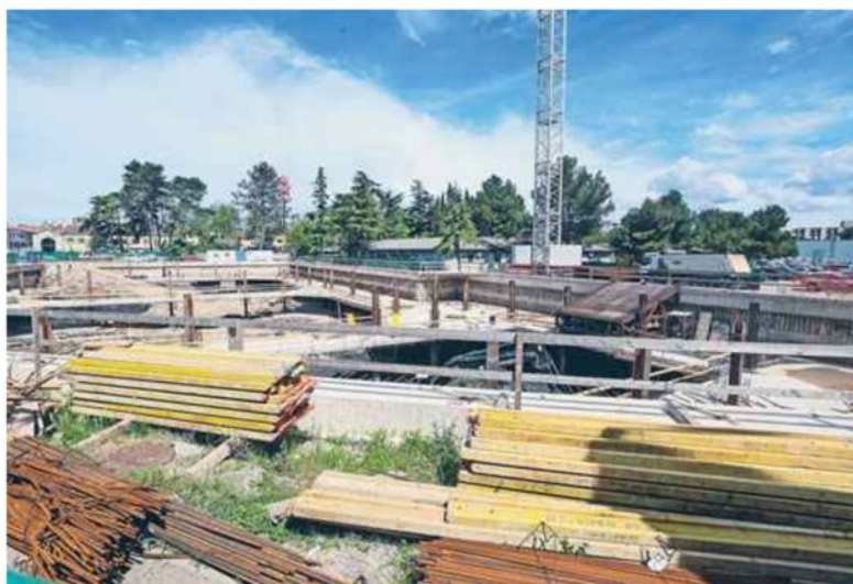
Ko bo zgrajen, bo Levji grad ponujal luksuzna stanovanja velikih kvadratov.

Za trisobno, ki ima 208 kvadratov, od tega 117 kvadratov terase, je potrebno odšteti 650.000 evrov, torej 3100